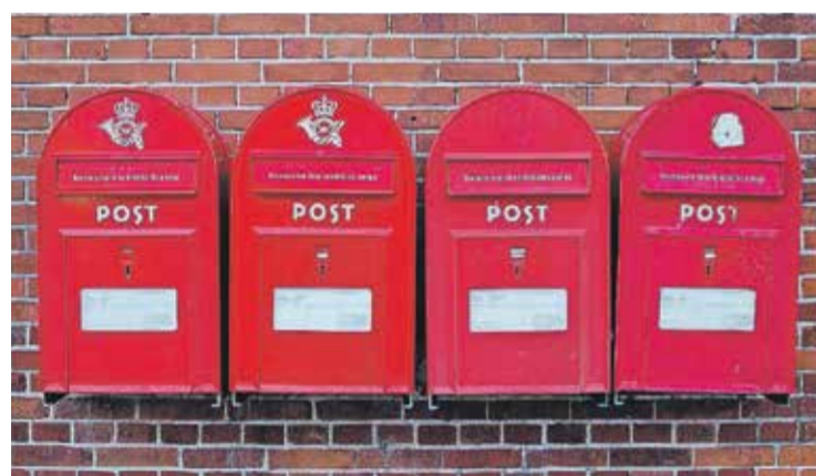
V zadnjih dneh decembra so na Danskem odstranjevali rdeče poštne nabiralnike in jih prodajali kot nekakšne suvenirje na spletnih dražbah.

Izvajalec univerzalne poštne storitve lahko odstrani poštni nabiralnik, če na podlagi dveh 14-dnevnih neprekinjenih štetij v razmiku najmanj treh mesecev ugotovi, da je v njem povprečno manj kot deset pošilk korespondence na dan. Ta določba ne velja za naselja, v katerih je nameščen samo en poštni nabiralnik, kontaktna točka pa ni organizirana, pravi splošni akt o kakovosti izvajanja univerzalne poštne storitve.