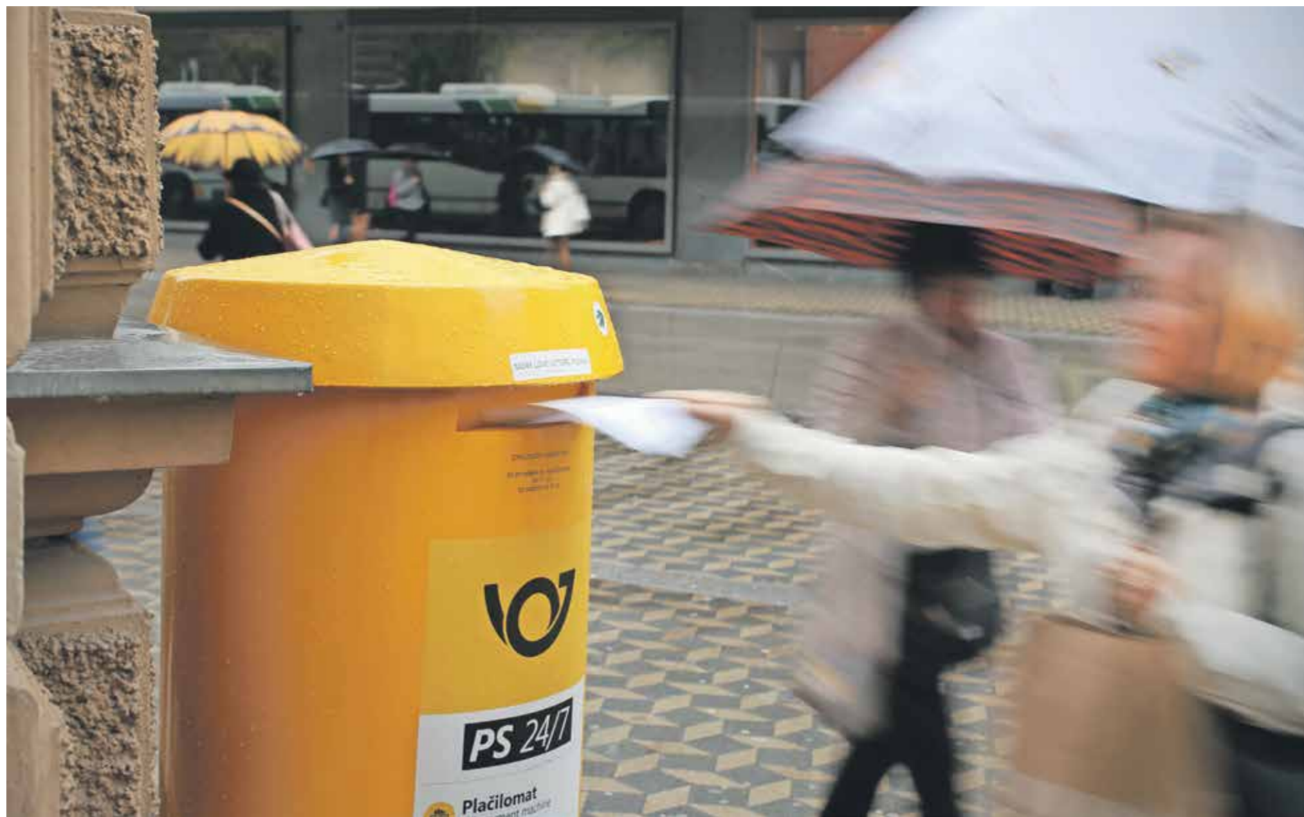
Od leta 2011 se je obseg pisemskih pošilk v Sloveniji zmanjšal za 65 odstotkov, trend pa se nadaljuje s približno 13-odstotnim letnim upadom.

Makedoniji, atomsko-biološko-hemijska odbrana, frajer! – mi je uspelo razumeti, za kaj gre. Podzemni bunkerji, komandni centri in štirje silosi, globoki po trideset metrov, to so bili ostanki raketnega izstrelišča, ki so ga Rusi tu v največji tajnosti gradili v šestdesetih letih. In to za rakete z jedrskimi glavami, ki bi štiri evropska mesta hkrati spremenile v prah. Na srečo ni bil nikoli v rabi. Srhlija znamenitost. Srhlijiv in hkrati veličasten je bil tudi pogled na Hrib križev. Kryžiu kalnas je kombinacija verske vne-meni in narodnega ponosa. Najmanj